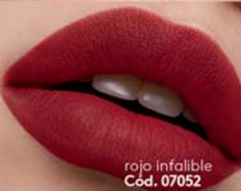
rojo infalible Cód. 07052