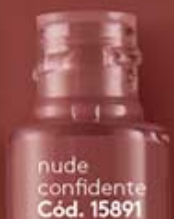
nude confidente Cód. 15891