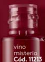
vino misterio Cód. 11213