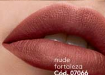
nude fortaleza Cód. 07066