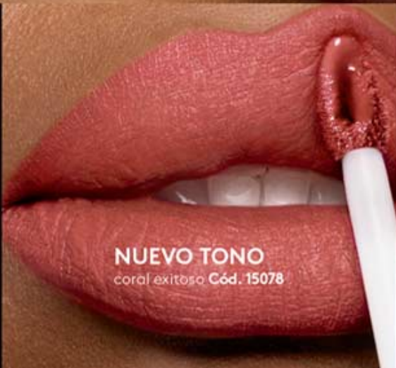
NUEVO TONO coral exitoso Cód. 15078