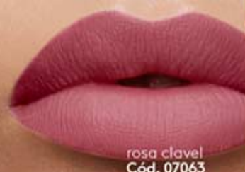
rosa clavel Cód. 07063