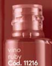
vino ruby Cód. 11216