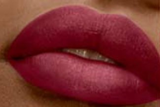
nude rose Cód. 11236