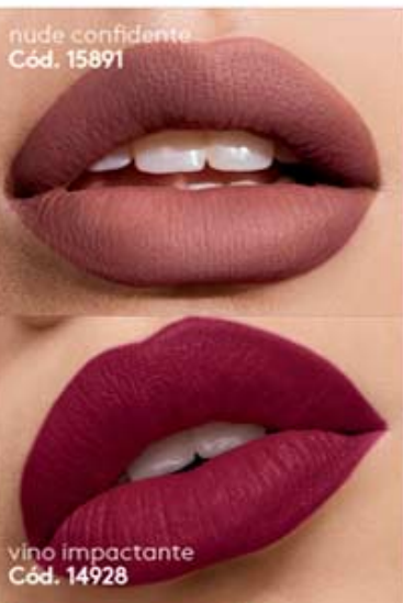
nude confidente Cód. 15891