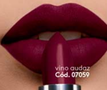
vino audaz Cód. 07059