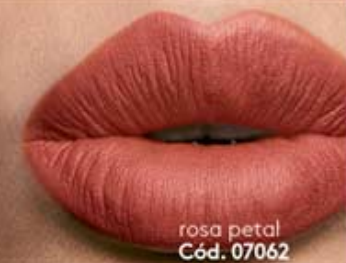
rosa petal Cód. 07062