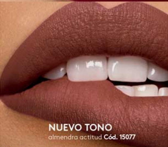
NUEVO TONO almendra actitud Cód. 15077