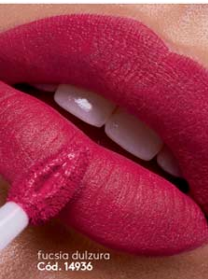
fucsia dulce Cód. 14936