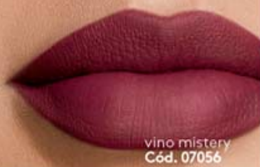
vino mystery Cód. 07056