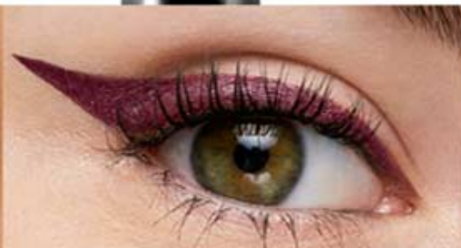
plumón vino actitud Cód. 20696