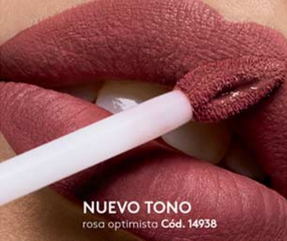
NUEVO TONO rosa optimista Cód. 14938