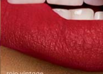
rojo vintage Cód. 11212