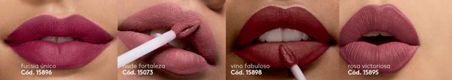
fucsia único Cód. 15896