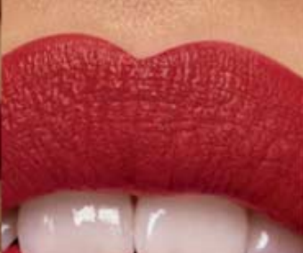
rojo carmín Cód. 11210