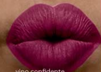
vino confidente Cód. 15899