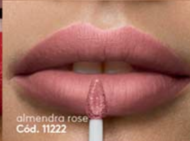
almendra rose Cód. 11222