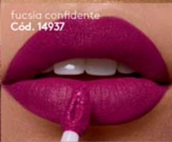
fucsia confidente Cód. 14937