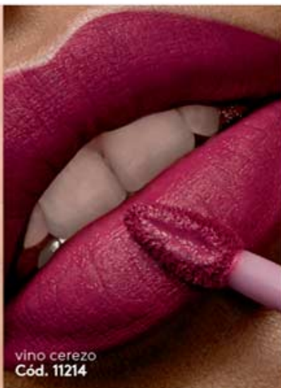
vino cerezo Cód. 11214