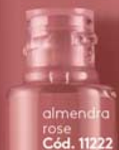
almendra rose Cód. 11222