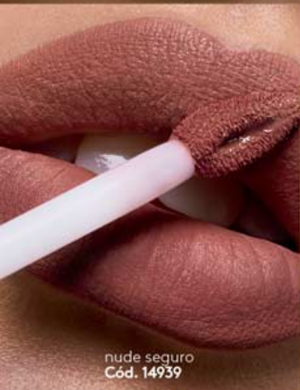
nude seguro Cód. 14939