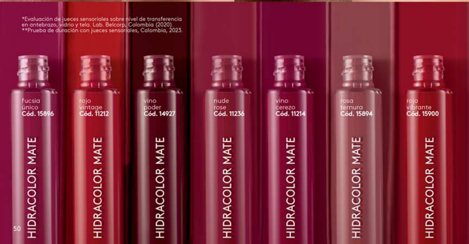
fucsia único Cód. 15896

*Evaluación de jueces sensoriales sobre nivel de transferencia en antebrazo, vidrio y tela. Lab. Belcorp, Colombia (2020). **Prueba de duración con jueces sensoriales, Colombia, 2023.