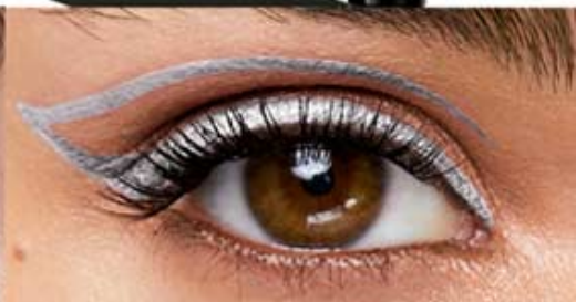
pincel plata genuino Cód. 03549 plumón plata genuino Cód. 03631