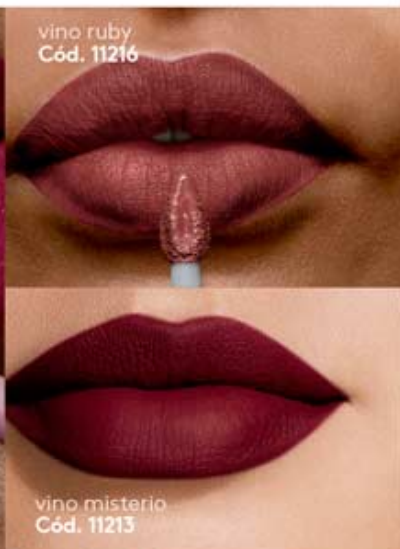
vino rubí Cód. 11216