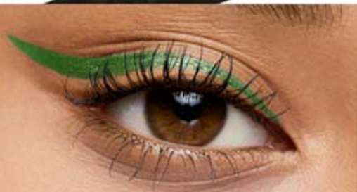
plumón verde soñador Cód. 20698