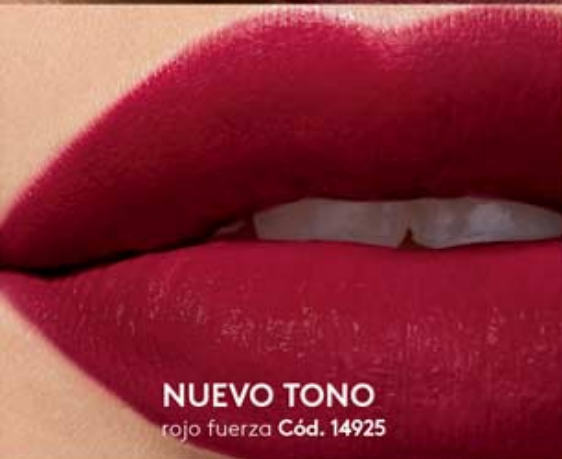
NUEVO TONO rojo fuerza Cód. 14925