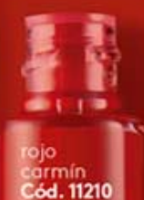
rojo carmín Cód. 11210