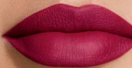
vino sexy Cód. 06949