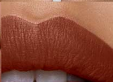
nude cálido Cód. 15893